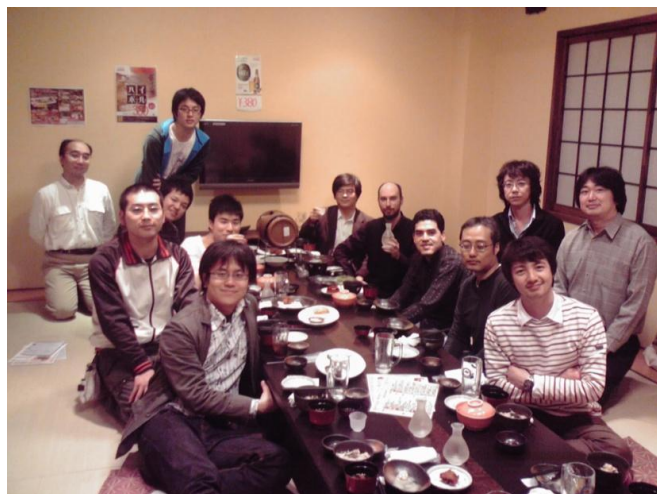
写真は研究室飲み会のもの

各人がこれらの研究テーマについてそれぞれ研究を行っていますが、これらの研究テーマは密接に関連し、原子核のような小さな世界から中性子星のような大きな世界にまたがった研究を進めています。また、大学院教育は理学部物理の原子核理論研究室と協力して行っています。