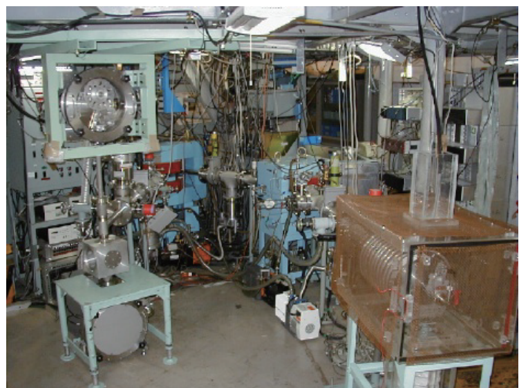
核ビームを作り出すオンライン同位体質量分析器