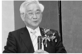
益川敏英博士 (2009年2月祝賀会にて)