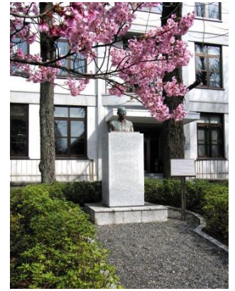
湯川記念館(1952-) と湯川博士の銅像