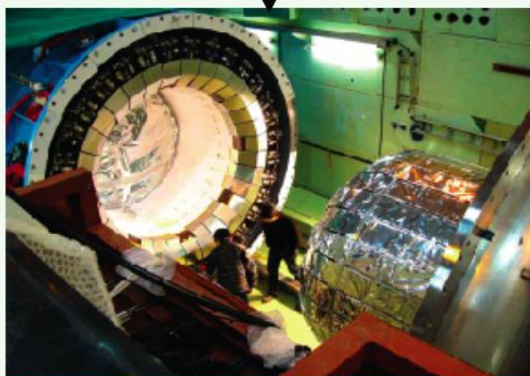
検出器の建設風景