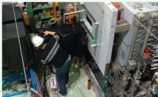
昨年度行った実験での作業風景