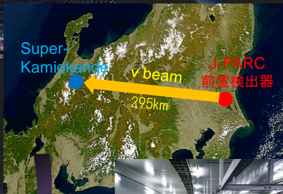
Super-Kamiokande \nu beam 295km J-PARC 前置検出器