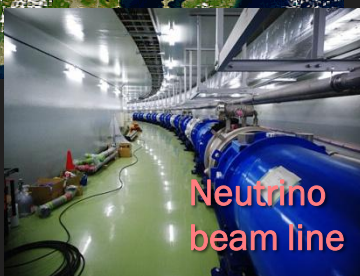
Neutrino beam line