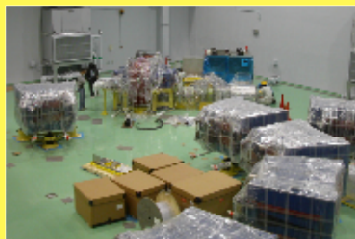
建設中の陽子150 MeV FFAG加速器

現在熊取キャンパスでは150MeV陽子FFAG加速器の建設を進めています。今年の夏までに入射器からのファーストビームが、来年1月には150MeVの陽子ビームの取出が計画されています。我々のグループはこの加速器の建設で中心的な役割を担っており、加速器完成後は原子核物理・核物性分野への利用を計画しています。